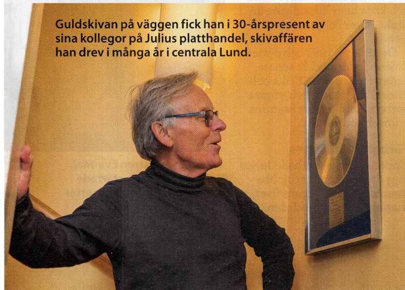
Guldskivan på väggen fick han i 30-årspresent av sina kollegor på Julius platthandel, skivaffären han drev i många år i centrala Lund.

– Han sa att det var mot hans religion och bad oss arrangörer att ändra ordningen. När vi frågade om Chuck Berry kunde tänka sig att spela före blev han förbannad och drog därifrån ihop med sin fru. Chuck hade beställt en egen vit Mercedes.