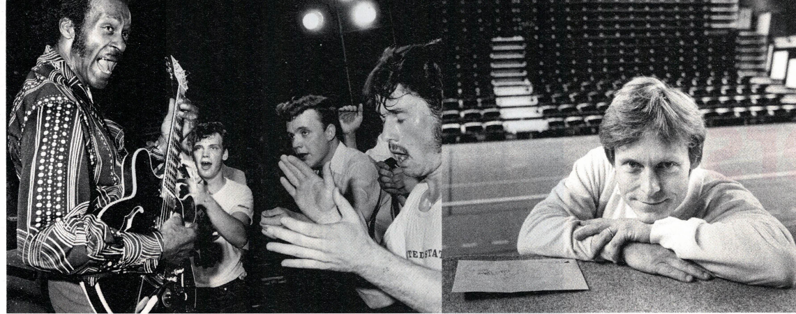
Chuck Berry på Olympen 1980. Berry blev förbannad när han blev tillfrågad om att spela före de andra artisterna.