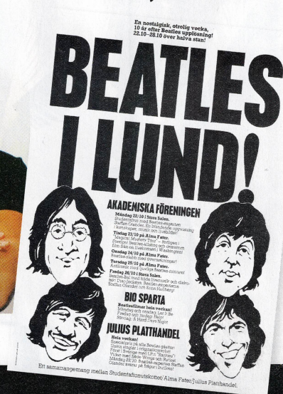
Beatles hyllades 1979.